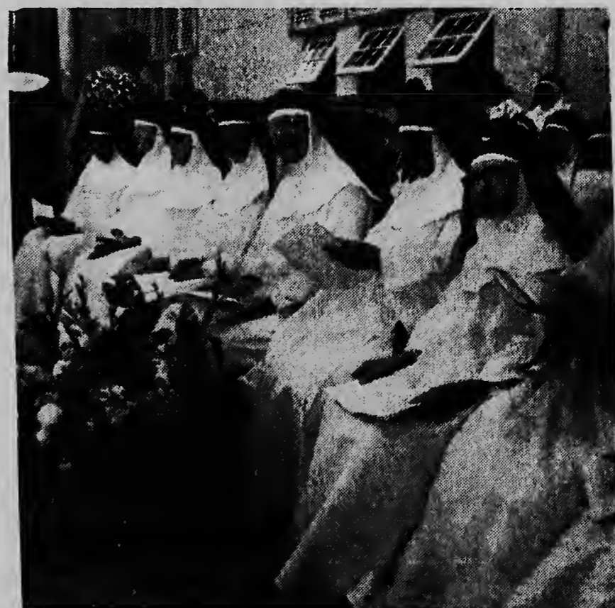
Un grupo dje soeurnan Dominicanan, cu den center e superiora general cu a bini di Hulanda.